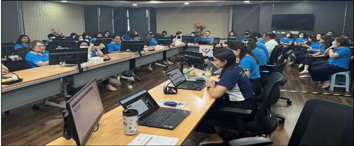
ภาพที่ ๓ การเข้าร่วมประชุม Monday KM เมื่อวันที่ ๑๘ ธันวาคม ๒๕๖๖

นอกจากนี้ เมื่อวันที่ ๕ กุมภาพันธ์ ๒๕๖๗ สถาบันได้จัดพิธีประกาศเจตนารมณ์การป้องกันการทุจริตประพฤติมิชอบและส่งเสริมคุณธรรม พร้อมประกาศเจตนารมณ์เป็นองค์กรคุณธรรมต้นแบบ โดยมีผู้อำนวยการและบุคลากรของสถาบันเข้าร่วมในงานดังกล่าว