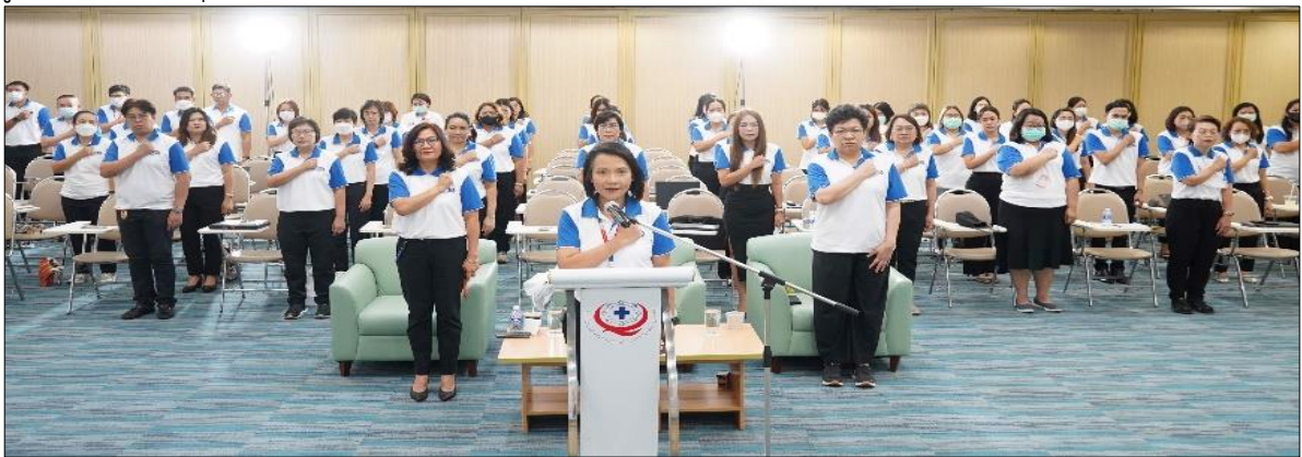
ภาพที่ ๔ พิธีประกาศเจตนารมณ์

นอกจากนี้ เมื่อวันที่ ๕ กุมภาพันธ์ ๒๕๖๗ สถาบันได้จัดพิธีประกาศเจตนารมณ์การป้องกันการทุจริตประพฤติมิชอบและส่งเสริมคุณธรรม พร้อมประกาศเจตนารมณ์เป็นองค์กรคุณธรรมต้นแบบ โดยมีผู้อำนวยการและบุคลากรของสถาบันเข้าร่วมในงานดังกล่าว