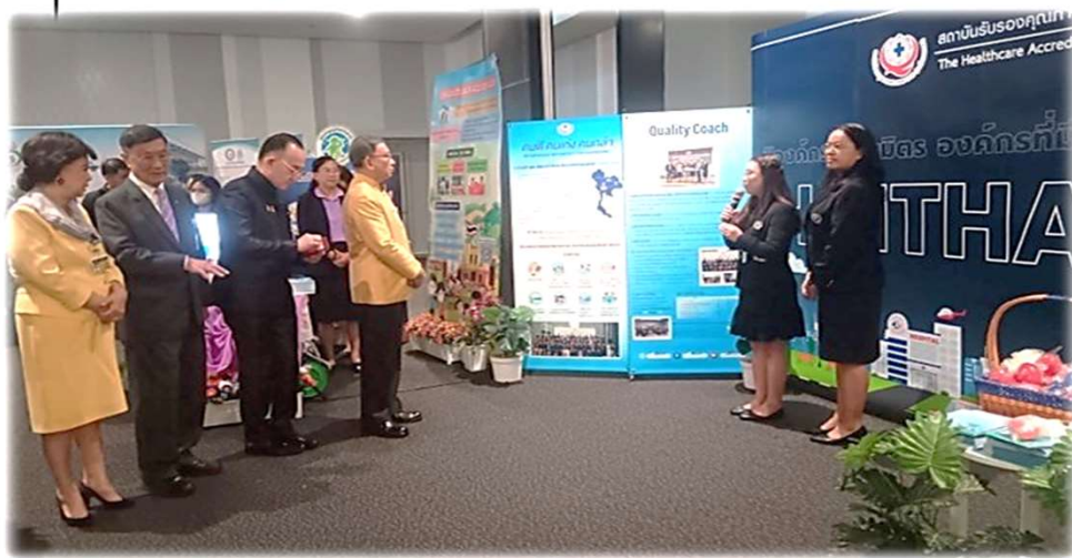
ภาพถ่ายสะท้อนค่านิยมองค์กร : I : Improvement (หมุนวนรอบการพัฒนา)