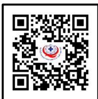
รายละเอียดหลักสูตร

รองผู้อำนวยการสถาบันรับรองคุณภาพสถานพยาบาล