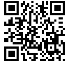
QR code for Map