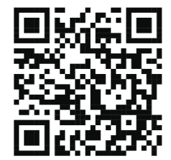
QR code for Google Map