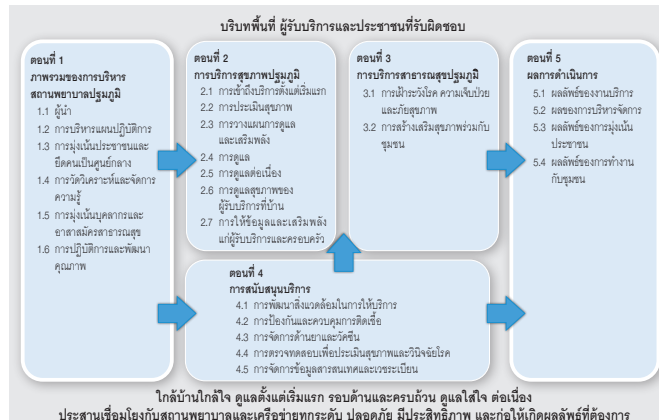
รูปที่ 2 กรอบมาตรฐานสถานพยาบาลปฐมภูมิ