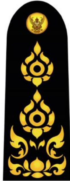
อินทราฐเจ้าหน้าที่และลูกจ้าง ในตำแหน่งอื่น