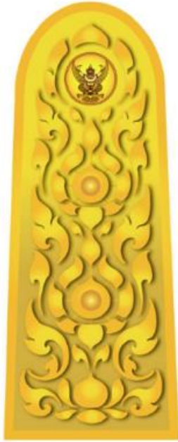
อินทราฐผู้อำนวยการและ เจ้าหน้าที่ในตำแหน่งบริหารระดับสูง