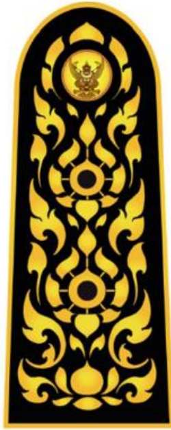
อินทราฐเจ้าหน้าที่ ในตำแหน่งผู้บริหารระดับกลาง