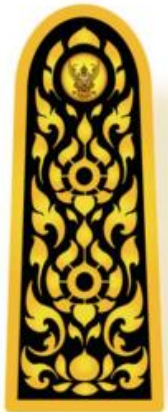
แสดงภาพตัดขวางอินทราฐมีความโค้ง

รูปแบบ อินทราฐมีลักษณะเป็นรูปสี่เหลี่ยมผืนผ้าแนวตั้งปลายด้านบนมนโค้งมีกระดุมครุฑ สีทองประดับอยู่ด้านบนมีรูปลายไทยประกอบเต็มพื้นที่