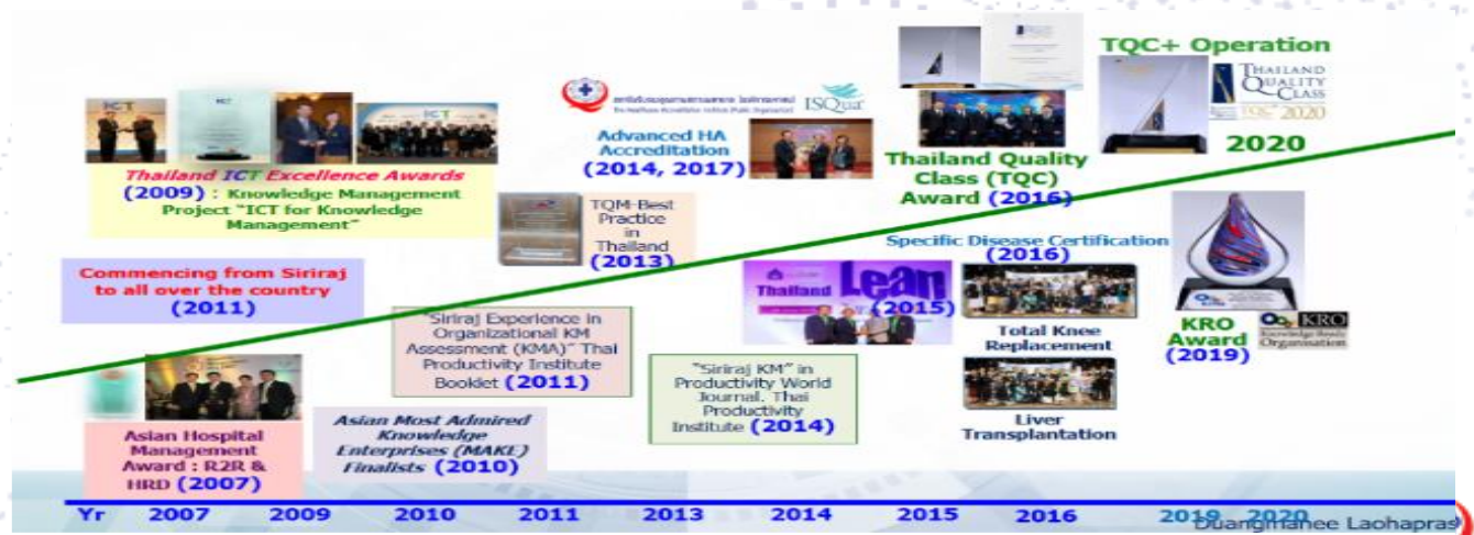
รูปที่ 3 การรับรองมาตรฐานและการรับรางวัลเป็นแห่งแรกของประเทศ

จากการเรียนรู้สู่ AHA อย่างต่อเนื่อง ทำให้มีการต่อยอดสู่การพัฒนาหลักสูตรและสร้างกระบวนการเรียนรู้มาตรฐาน เครื่องมือคุณภาพ ที่เอื้อต่อการปฏิบัติงานของบุคลากรทั้งคณะฯ เชื่อมโยงกับระบบ HRM และ HRD และการประยุกต์ใช้เกณฑ์และมาตรฐานต่างๆ อย่างบูรณาการ ส่งผลให้ปี พ.ศ. 2559 คณะฯ ได้รับรางวัล Thailand Quality Class (TQC) และปี พ.ศ. 2563 ได้รับรางวัล TQC Plus: Operation จากสถาบันเพิ่มผลผลิตแห่งชาติ นับเป็นสถาบันการศึกษาและคณะแพทย์แห่งแรกของประเทศที่ได้รับรางวัลทั้งสองนี้ รวมทั้งรางวัลต่างๆ เป็นแห่งแรกของประเทศ (รูปที่ 3) ปลายปี พ.ศ. 2564 รับการเยี่ยมสำรวจเพื่อต่ออายุการรับรอง AHA ครั้งที่ 2 (อยู่ระหว่างการพิจารณาผลการประเมินจากกรรมการสถาบันรับรองคุณภาพสถานพยาบาล (องค์การมหาชน) (สรพ.) เกิดการเรียนรู้และต่อยอดกระบวนการเยี่ยมแบบ Empowerment & Hybrid evaluation ของสถาบันรับรองคุณภาพสถานพยาบาล (องค์การมหาชน) (สรพ.) เพื่อมุ่งสู่การเป็น World Class