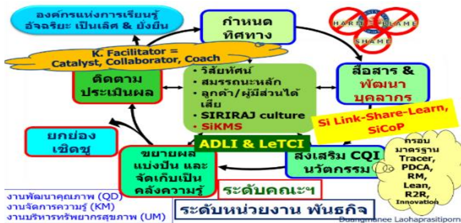
รูปที่ 2 กระบวนการพัฒนาคุณภาพ คณะแพทยศาสตร์ศิริราชพยาบาล